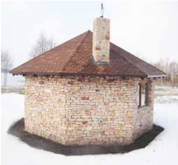
Песчаник в кладке садовой беседки