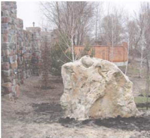
Глыба флороносного песчаника в ландшафте