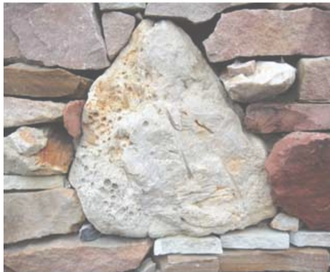
Плитка «дикого камня» в стенке

Рисунок 2. Использование эоценового песчаника в ландшафтном дизайне и строительстве.