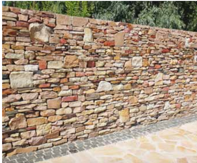
Песчаник в кладке стенки