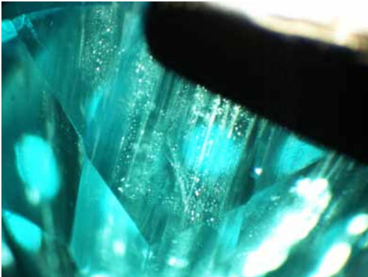
Рисунок 3. Вуалеподібні двофазові вклюдження спіралевидної форми в синтетичному смарагді, зб. 36

Методом рентгенофлуоресцентного аналізу визначено кількісний склад елементів-домішок синтетичного смарагда (табл. 1). Під час аналізу даних слід відзначити досить велику кількість V за дуже малої кількості Fe та відсутності Cr. У зв'язку з цим можна припустити, що головну роль у створенні блакитно-зеленого кольору каменя грав саме V [1, 4].