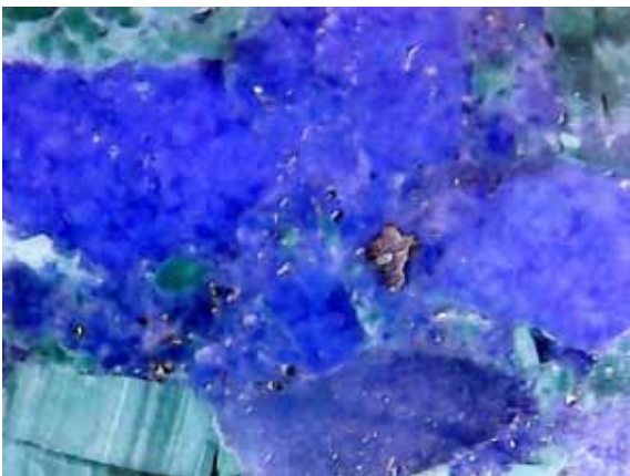
Рисунок 3. Включення піриту в лазуриті