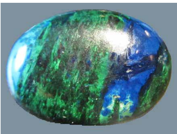
Рисунок 5. Кабошон з ейлатського каменю