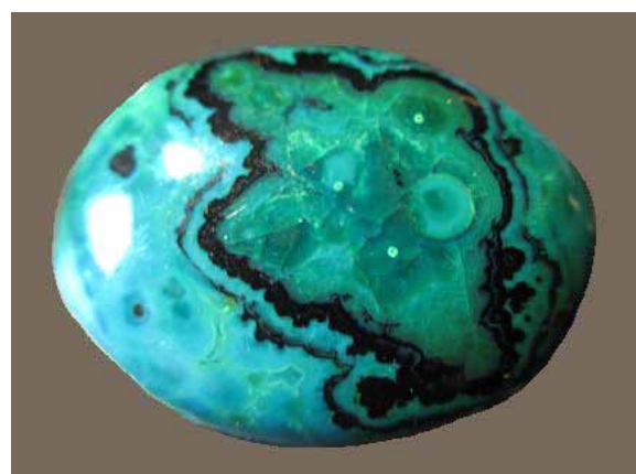
Рисунок 6. Кабошон з ейлатського каменю