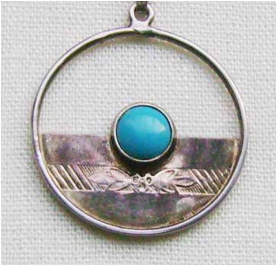
Рисунок 1. Підвісок з ейлатським каменем