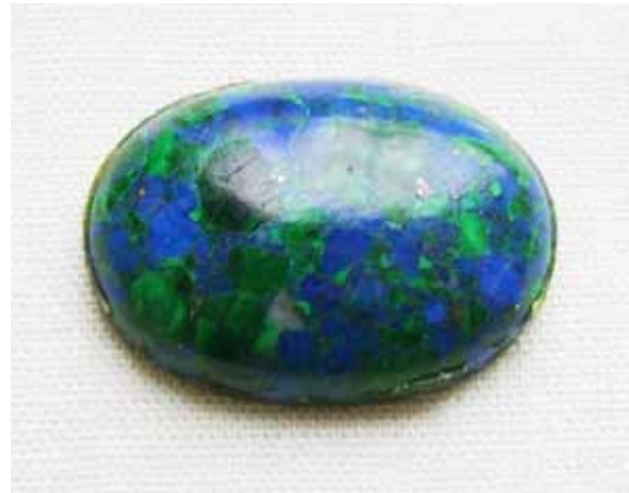
Рисунок 2. Кабошон з ейлатського каменю