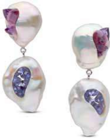
Рисунок 8. Прісноводні перли в тандемі з кристалами аметистаму, танзаніту, Хісано Шеперд [1]