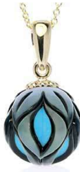
Рисунок 7. Синтетична бірюза в перлині, «Galatea» [4]