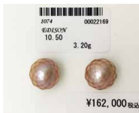
Рисунок 2. Ограновані прісноводні перли Едісона, Ø 10,50 мм [2]