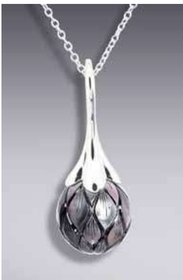
Рисунок 6. Різьблена перлина, «Galatea» [4]