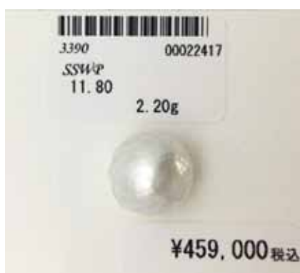
Рисунок 1. Огранована перлина Південних морів, Ø 11,8 мм [2]

Отже, сьогодні з'явилося багато технік обробки культивованих перів, які диктує ринок світової моди.