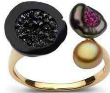
Рисунок 9. Каблучка з таїтянською перлиною, що інкрустована чорними алмазами, таїтянською перлиною-кеші в тандемі з рубінами та перлиною-кеші Південних морів, Хісано Шеперд [1]