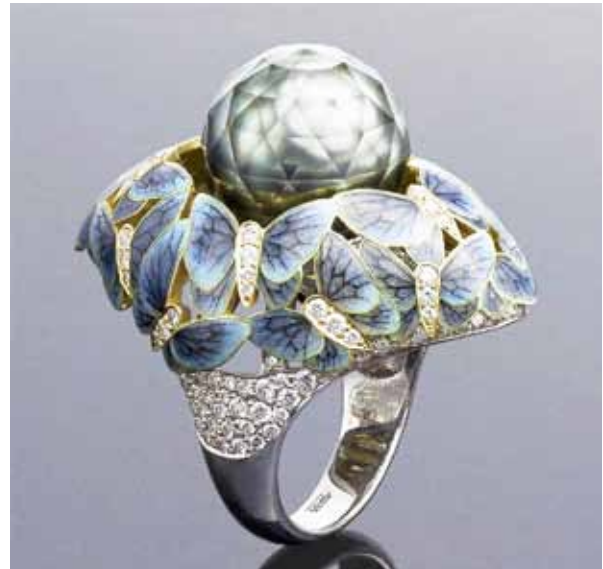
Рисунок 4. Обручка «Метелики». Ільгіз Фазулзянов, Віктор Тузлуков.