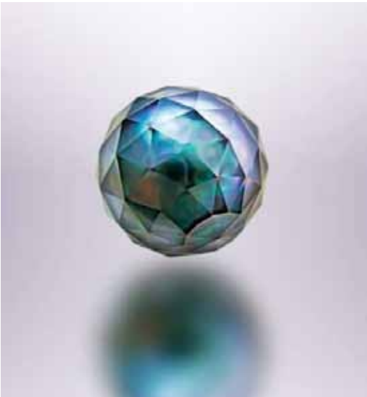
Рисунок 3. Огранована таїтянська перлина Віктора Тузлукова, Ø 17 мм (США, приватна колекція). Фото В. Тузлукова