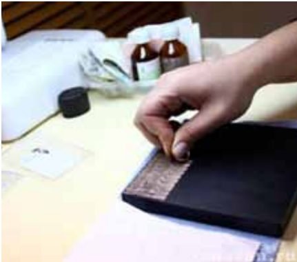
Рисунок 3. Опробування на пробірному камені

Якщо на виробі виявлено підроблене клеймо – потрібно ретельно застосувати весь алгоритм експертизи.