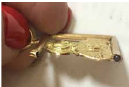
Рисунок 6. Ладанка з образом Святого