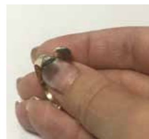
Рисунок 5. Сережки з підробленими клеймами