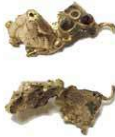
Рисунок 7. Підвісок у вигляді сови без клейма, загальна маса – 0,92 г

Приклад 3. Опис предмета: підвісок без клейма, кустарна робота, з внутрішнім наповнювачем у вигляді глини (рис. 7).