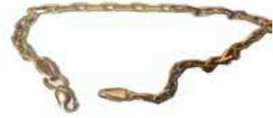
Рисунок 8. Браслет, позолочений НДМ, загальна вага – 7,25 г, клеймо на дужці оригінальне на золото 585 проби

Приклад 4. Опис предмета: браслет з недорогоцінного сплаву, на поверхню якого нанесена позолота, клеймо справжнє, відповідає 585 пробі золота, яке нанесене на підсадному кільці (рис. 8).