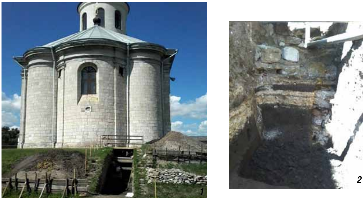
Рисунок 3. Церква Успіння Пресвятої Богородиці (перша половина XVI ст.) в с. Крилос (1) та фрагменти її фундаменту (2)

розкопи фрагментів її фундаменту, і надалі використовувались алебастрові блоки (рис. 3). Таке використання алебастру також виявлено у фундаменті Тисменицької брами в сучасному Івано-Франківську, а в населених пунктах, близьких до покладів алебастру в цьому регіоні, є звичним його використання для будівельних потреб.