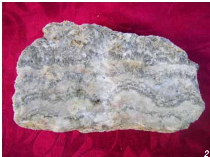
Рисунок 5. Виходи алебастровмісних гіпсів в околицях Кукільників (1) і структурно-текстурні особливості алебастру (2)