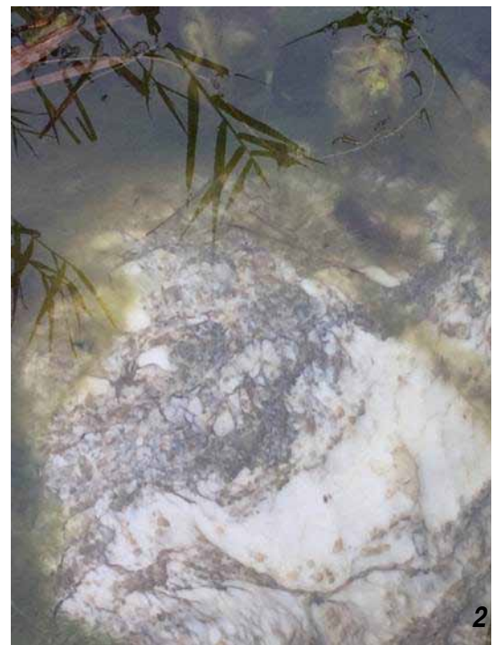
Рисунок 7. Сучасні сліди останніх промислових розробок алебастру в Новошино. Затоплений кар'єр (1) і реліктові фрагменти алебастру у воді (2)