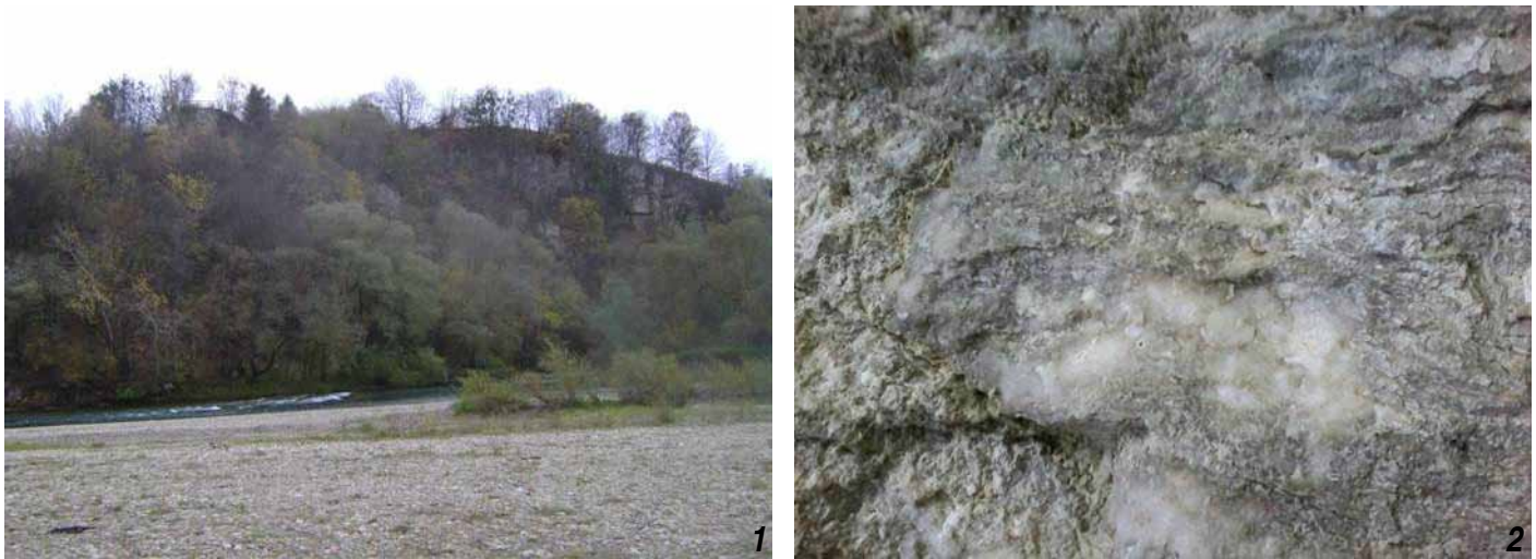
Рисунок 2. Ймовірне джерело алебастру для Успенського кафедрального собору в с. Крилос поблизу села Сокіл. Відслонення над рікою Луквиця (1) і фрагмент алебастру у відслоненні (2)