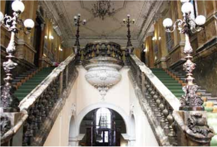
Рисунок 6. Алебастр в інтер'єрі роботи Леонарда Марконі. XIX ст. Алебастрові прикраси сходів у сучасному музеї етнографії, м. Львів