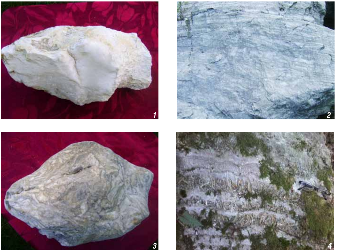
Рисунок 9. Основні відміни алебастру: 1 – білий масивний, 2 – світлий смугастий, 3 – сірий складної будови, 4 – поєднання алебастру з крупними кристалами прозорого гіпсу