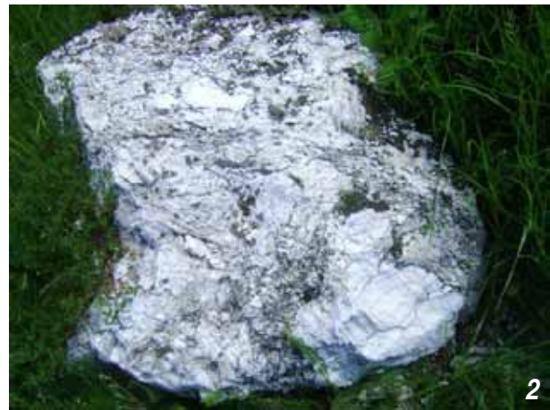
Рисунок 4. Алебастр в Підмихайлівцях. 1. Релікти давньої каменоломні. 2. Фрагмент алебастру-сирця